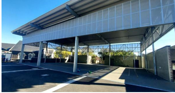
Play spaces/ Posti per giocare