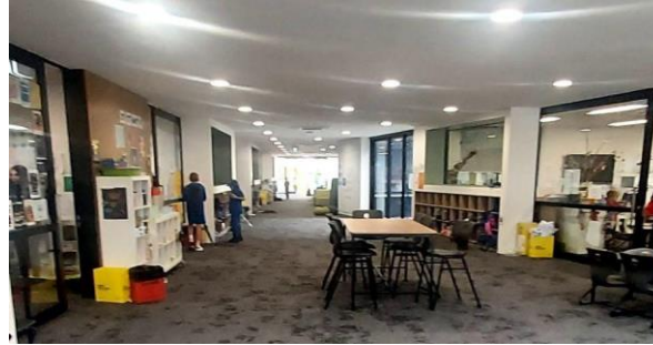
Learning spaces/ Posti per imparare